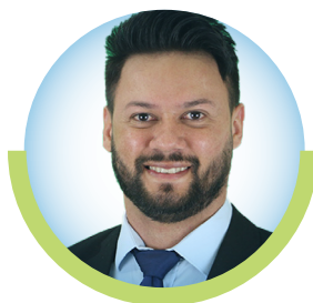
VEREADOR Lei UNIÃO BRASIL